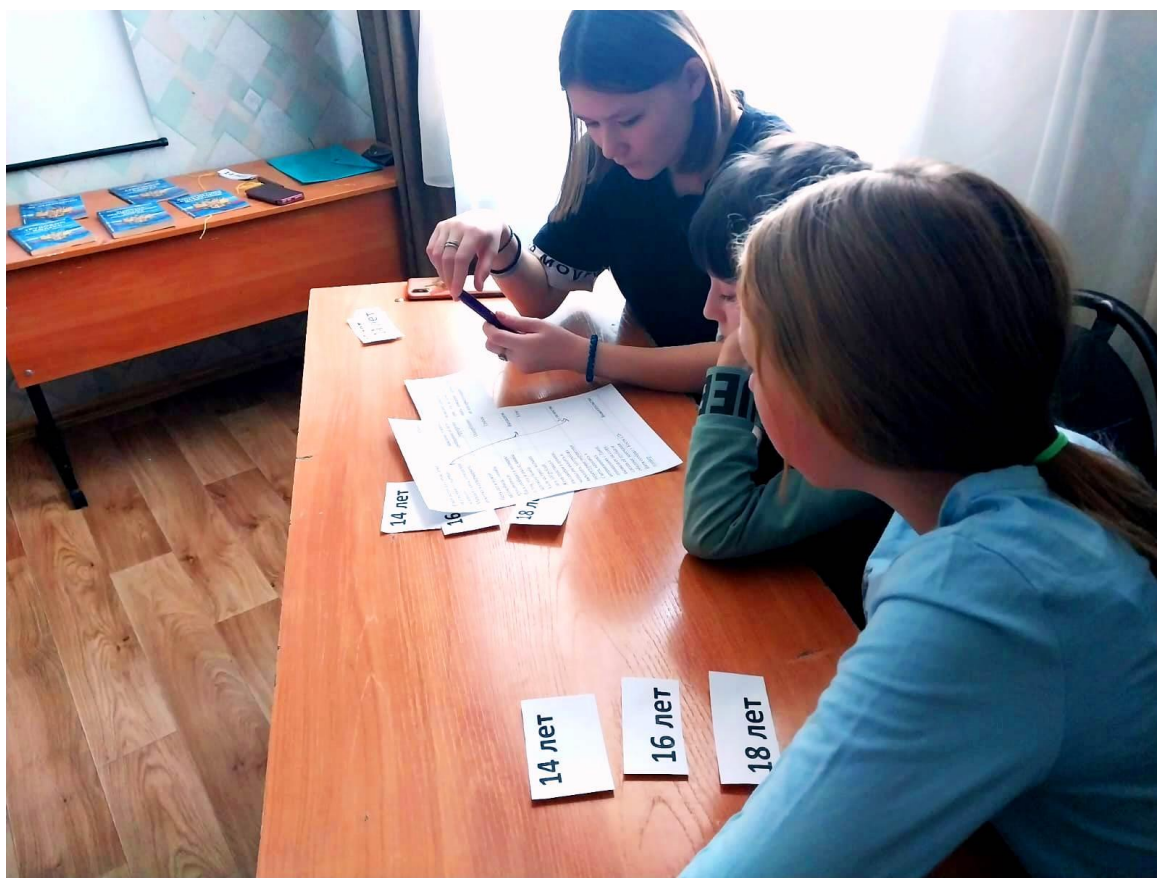
Занятие «Подросток и закон»