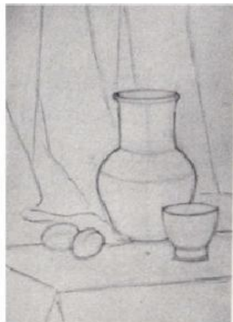
Рис. 1 Подготовительный рисунок